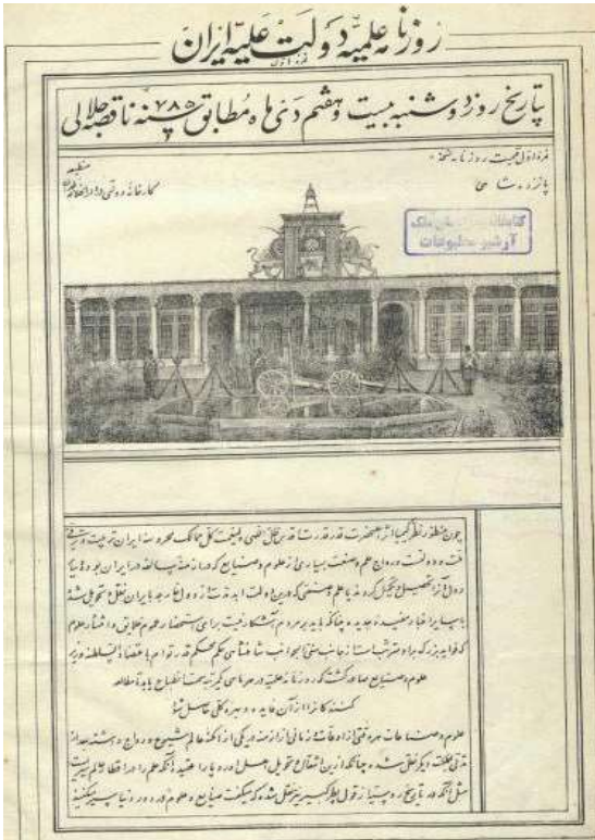
تصویری از روزنامه دولت علیه ایران