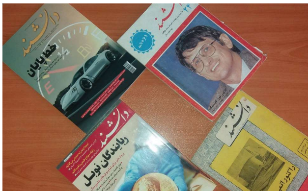
تصویری از شماره ۸ در سال ۱۳۴۵، در کنار یک ویژه نامه در سال ۱۳۶۵، و دو شماره جدید در سال‌های ۱۳۹۵ و ۱۳۹۹